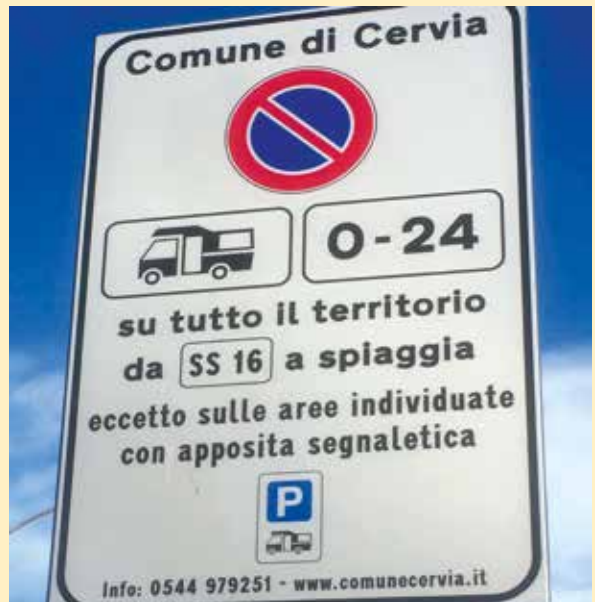
Segnaletica anticamper rimossa

L'Associazione Nazionale Coordinamento Camperisti è intervenuta nei confronti del Comune di Cervia a causa dell'ordinanza n. 269 del 10 luglio 2015 con la quale l'ente