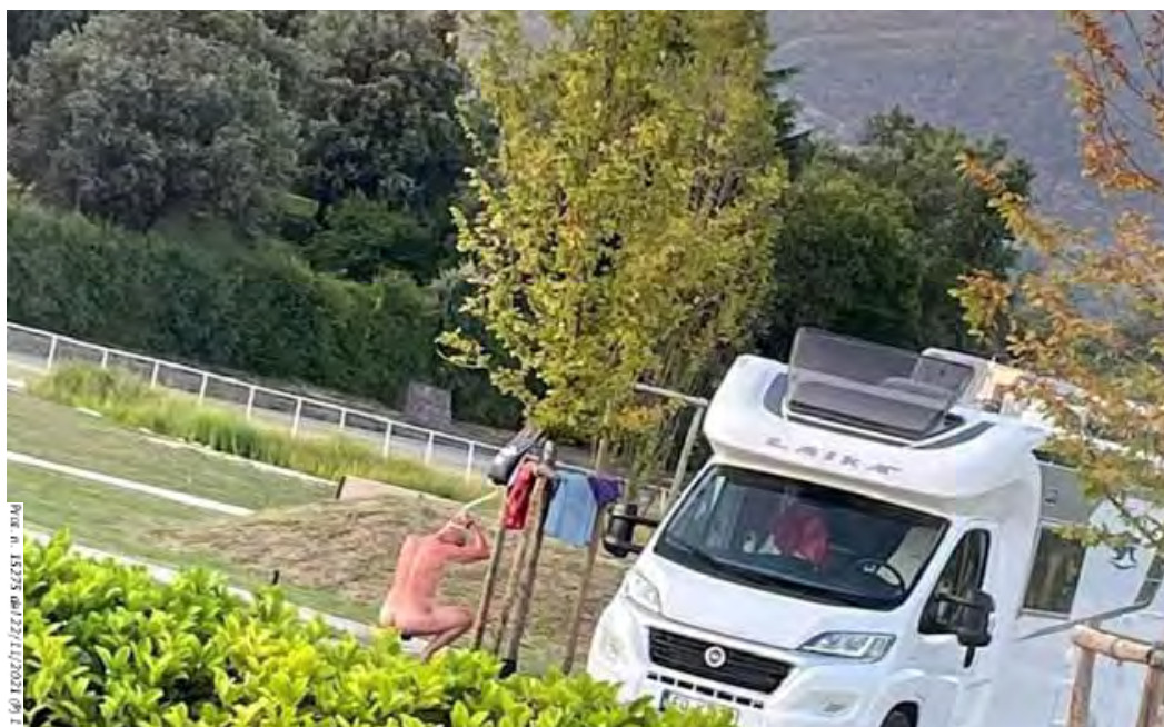
Foto allegata alla lettera Prot. n. 14828 del Comune di Costermano

L' ASSOCIAZIONE NAZIONALE COORDINAMENTO CAMPERISTI , nel tempo, ha riscontrato situazioni simili. Un esempio è Costermano del Garda dove un sindaco, preso atto che il proprietario di un'autocaravan si faceva la doccia sotto un albero di un parco cittadino, invece di sanzionare tale azione, procedeva a far installare delle sbarre per impedire l'accesso al parco a tutte le autocaravan, spendendo almeno 10.467,60 euro dei cittadini, per poi doverle far rimuovere a seguito dell'intervento dell' ASSOCIAZIONE NAZIONALE COORDINAMENTO CAMPERISTI (articoli consultabili nei numeri 208 e 209 aprendo www.incamper.org ).