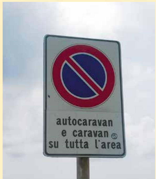
Segnaletica anticamper rimossa