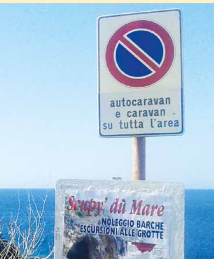
Segnaletica anticamper rimossa

to, transito e sosta autocaravan, camper e mezzi simili" presenti nel proprio territorio. Vale ricordare che l'Associazione Nazionale Coordinamento Camperisti è sempre di supporto e mai di contrapposizione agli enti proprietari e/o gestori della strada. Infatti, l'analisi del provvedimento istitutivo di una illegittima limitazione alla circolazione stradale delle autocaravan, è un ausilio prezioso per l'ente locale che, nella visione di buon governo, deve revocare tempestivamente il provvedimento stesso al fine di evitare indebiti oneri al cittadino e alla Pubblica Amministrazione.