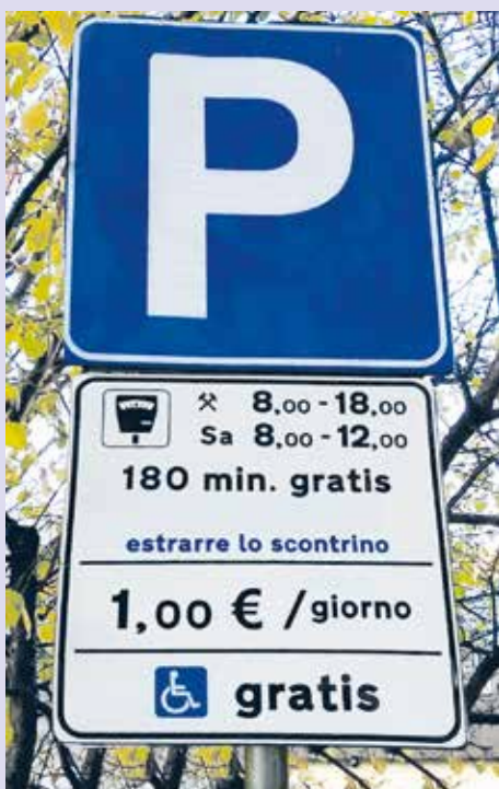
La segnaletica stradale nel rispetto dei disabili

Causale: cognome, nome, indirizzo e targa autocaravan