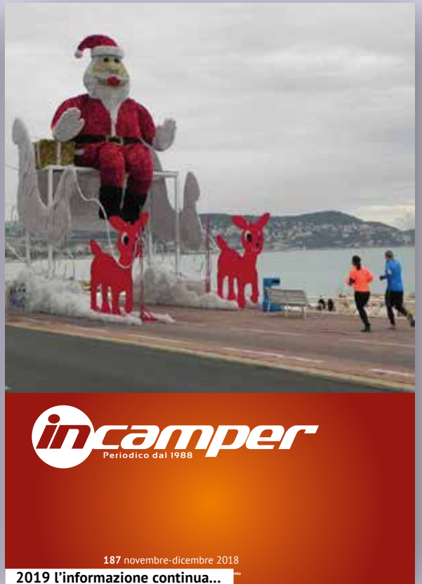
2019 l'informazione continua...