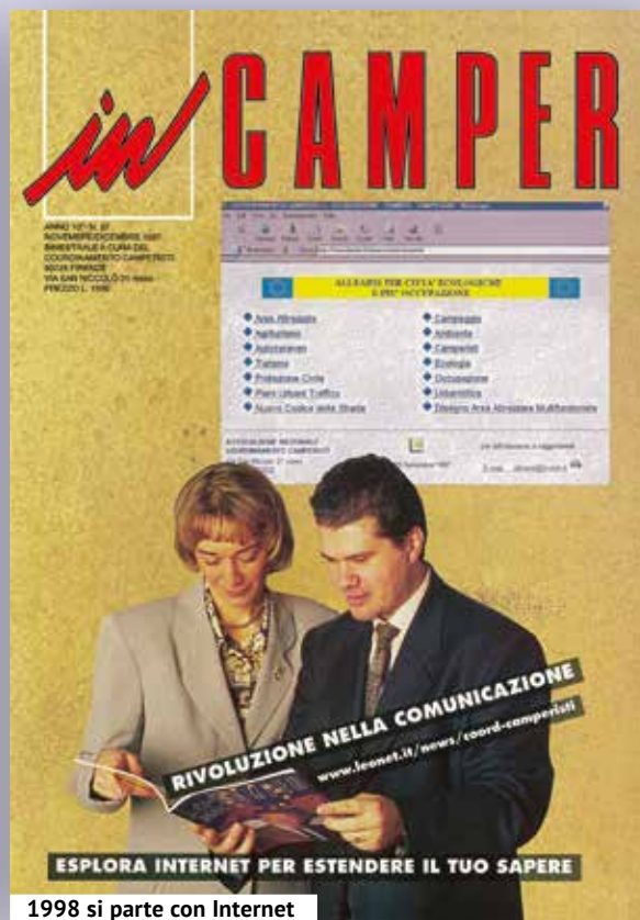
1998 si parte con Internet