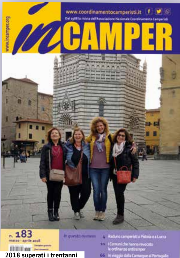
2018 superati i trentanni