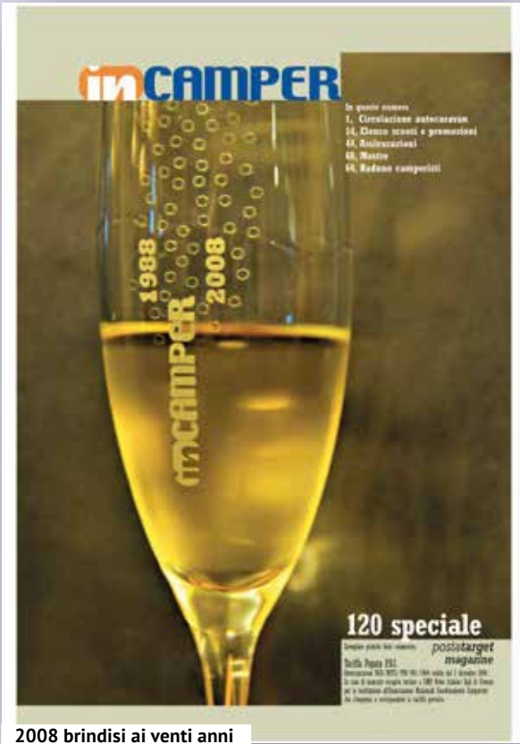
2008 brindisi ai venti anni